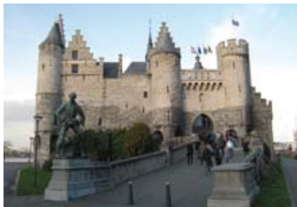
Wycieczka do Antwerpii. Forteca Steen.