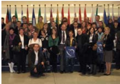
Zwiedzanie Parlamentu Pamiętkowe zdjęcie z Posłem Bogusławem Sonikiem

pejski, gdzie spotkali się z Posłem Bogusławem Sonikiem.